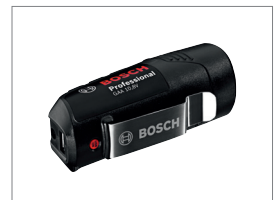
GAA 10.8V-LI 포함